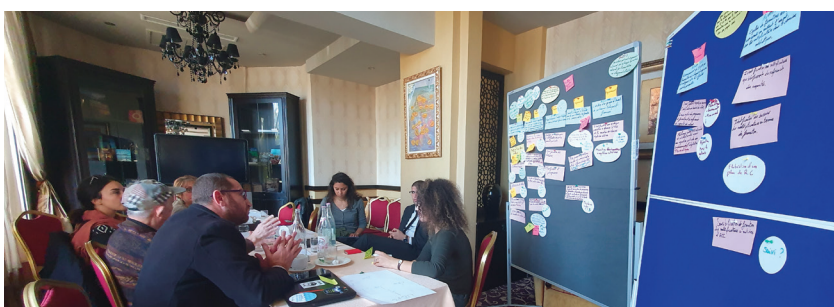
1 et 2- Planification participative avec l'ensemble des acteurs concernés par l'adaptation au changement climatique.

Le projet a pour objectif d'améliorer la gouvernance par rapport à l'adaptation au changement climatique en Tunisie à travers